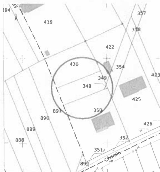
B 348 et 349